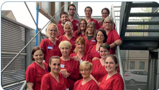
Das Team der MVZ-Praxis Onkologie